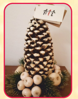
Porta candele (euro 12)