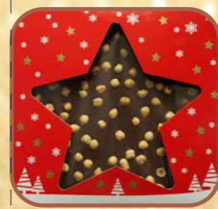
Stella cioccolato cioccolato al latte con nocchie intere gr450 (euro 12)