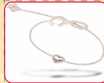
Braccialetto Cruciani swarovski (euro 15)