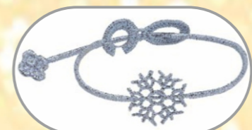
Braccialetti Cruciani AIL fiocco e stella (euro 10)