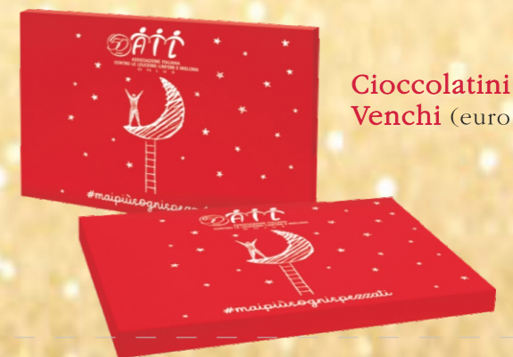
Cioccolatini Venchi (euro 15)

ATTENTI AI FURBETTI - ATTENTI ALLA TRUFFA TELEFONICA L'AIL non ha MAI autorizzato richieste di denaro, né per telefono né porta a porta. Diffidate di questi furbi che asseriscono di fare parte dell'Associazione Italiana contro le Leucemie, non hanno nulla a che fare con l'AIL. GRAZIE PER LA VOSTRA COLLABORAZIONE IN QUESTA COMPAGNA ANTI-TRUFFA.