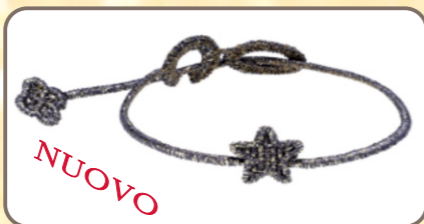
Braccialetto Cruciani argento (euro 10)