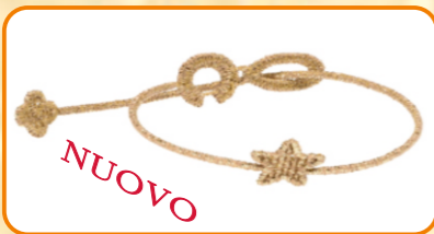
Braccialetto Cruciani oro (euro 10)