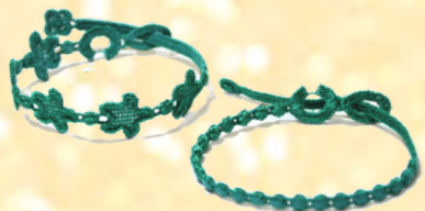
Braccialetto filo Rosso, Verde (euro 7)